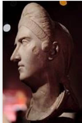
Portrait of Plotina Capitoline Museums, Rome

Juba sel ajal, kui Archigenes oli Kleopatra õukonna ja Citron Rooma keisri Trajani naise isiklik lõhnastaja, kasutati kannikeste ja liiliate ekstrakte ilu retseptides.